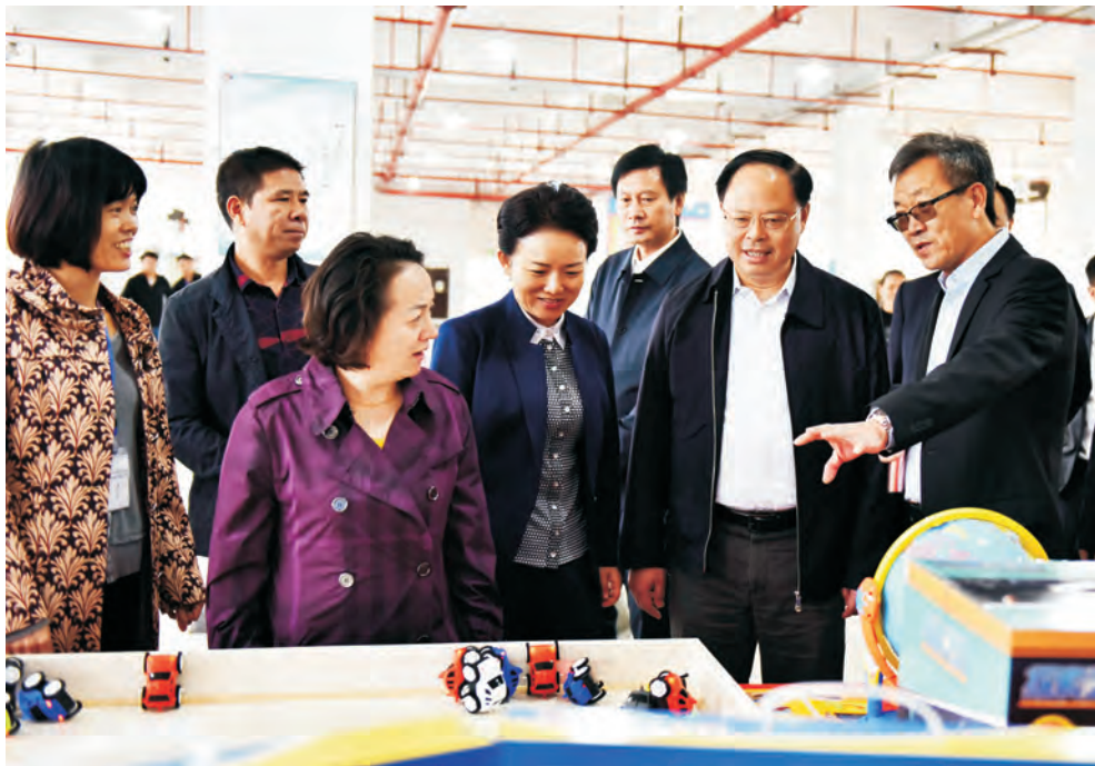
10月13日副省长张剑飞来蓝调研经济社会发展情况