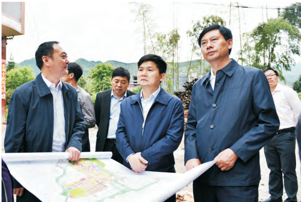
县领导集体调研重点项目