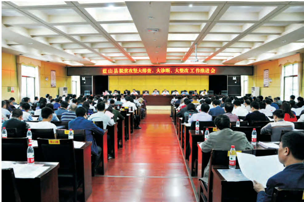
蓝山县脱贫攻坚大排查、大诊断、大整改工作推进会现场