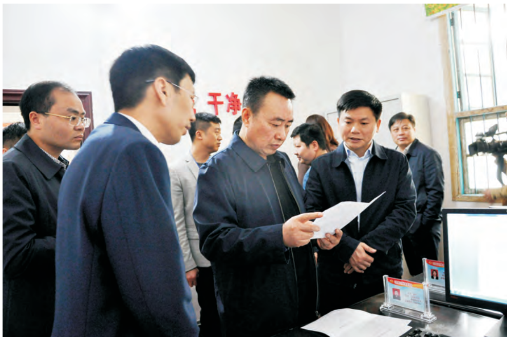
市委常委、市纪委书记杨永一行在毛俊镇政府实地检查调研