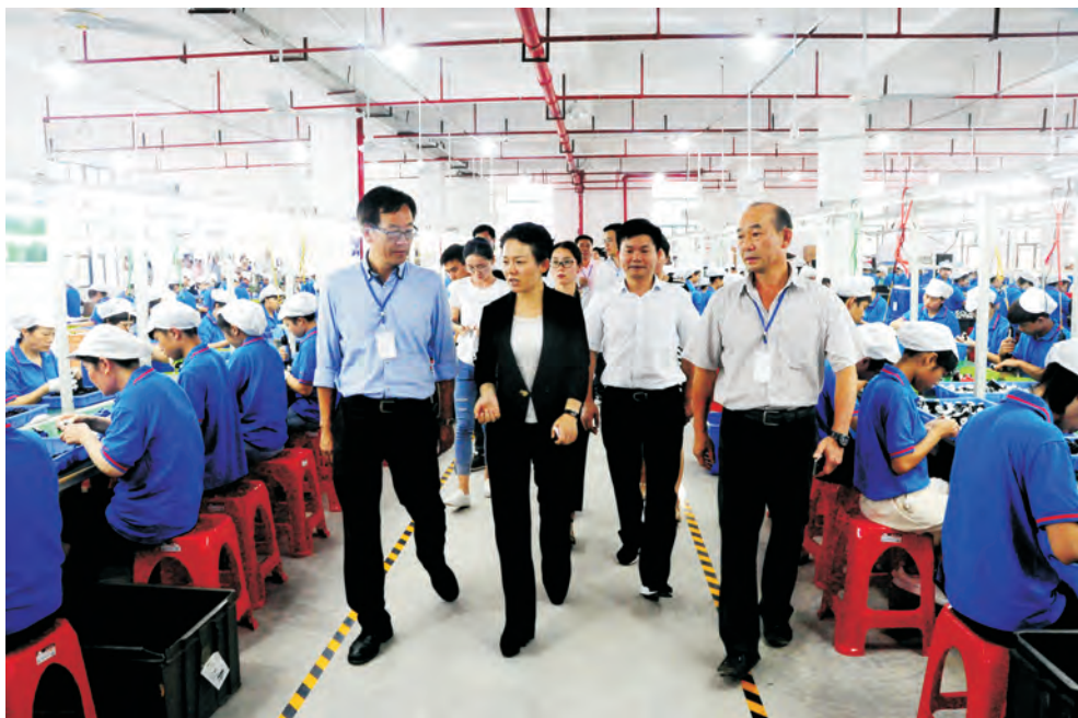
市委书记、市人大常委会主任李晖在全市重点项目流动现场会