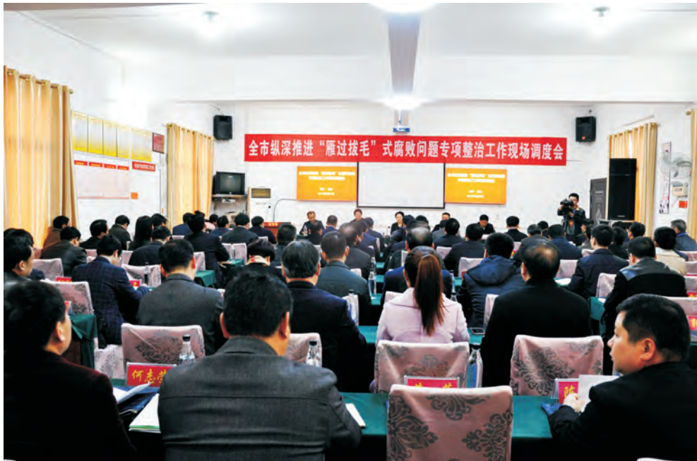
全市纵深推进“雁过拔毛”式腐败问题专项整治工作现场调度会